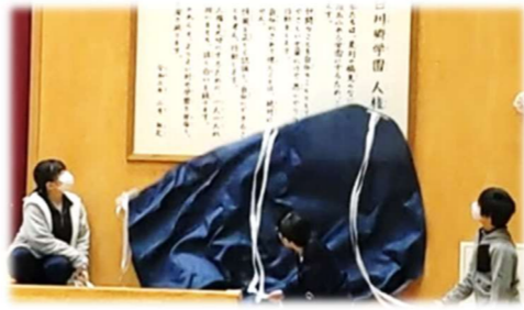
3/4 「人権宣言」看板除幕式

2/24「白川郷学園人権宣言」制定！ 完成した宣言文を、会執行部の思いや、人権擁護委員さんの思いと共に掲載したチラシを各家庭や地域に配布しました。 全校集会で人権宣言の除幕式を行いました。全校で宣言文を朗唱し、改めて、温かい村・笑顔あふれる学園にしようという思いを確かめました。